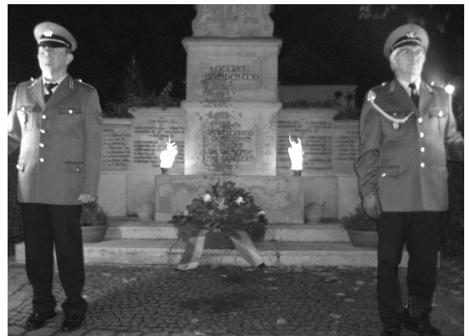
Ehrenwache am Kriegerdenkmal

Mit drei Salutböllern und dem Lied „Ich hatt’ einen Kameraden“ wurden die gefallenen und vermissten Soldaten und alle Opfer von Kriegen geehrt.